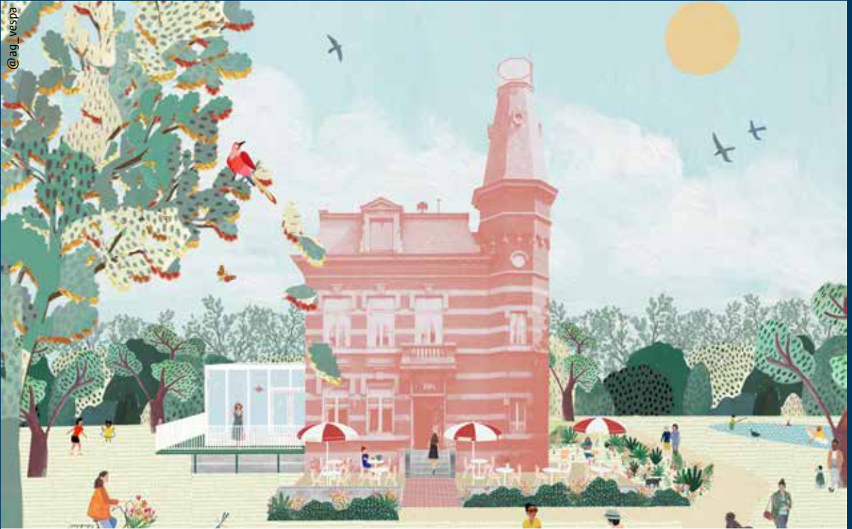
KOMAAN! Architecten maakte bij de aanvang van de werken dit toekomstbeeld van de Parkvilla. Wij kijken er alvast naar uit er een terrasje te doen in het zonnetje... als de omstandigheden het tegen dan toelaten!