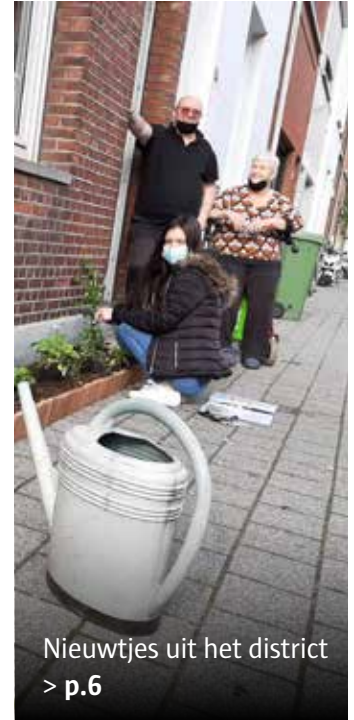
Nieuwtjes uit het district > p.6