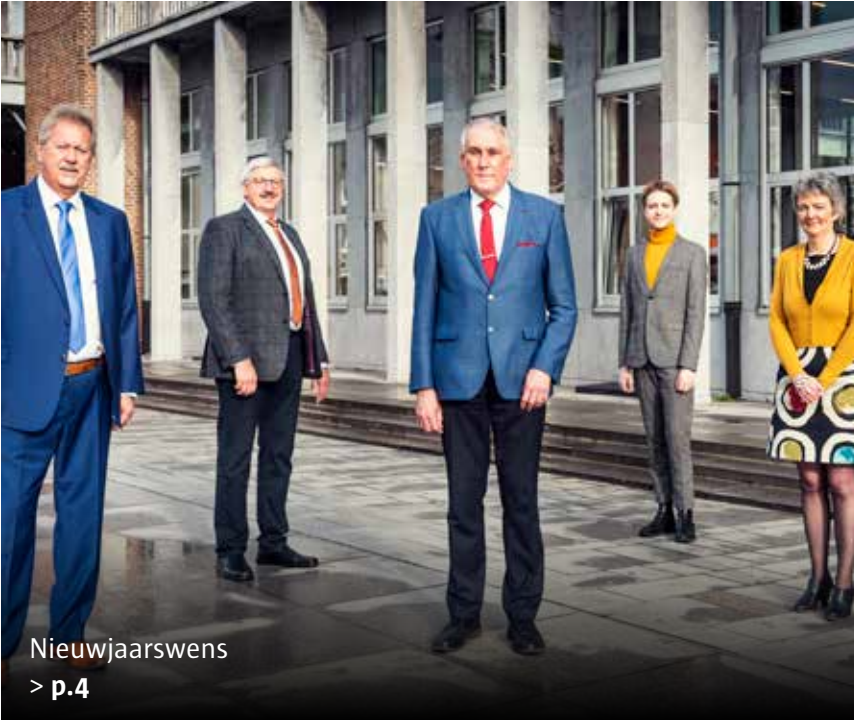
Nieuwjaarswens > p.4