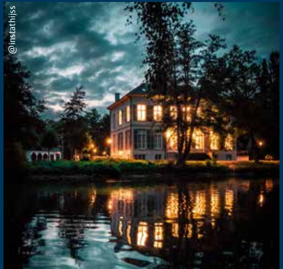
Kasteel Bouckenborgh zorgt voor licht in de duisternis.